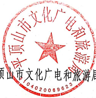
平顶山市文化广电和旅游局