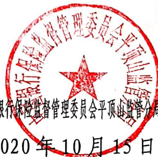
中国银行保险监督管理委员会平顶山监管分局