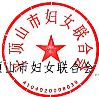
平顶山市妇女联合会