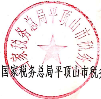
国家税务总局平顶山市税务局