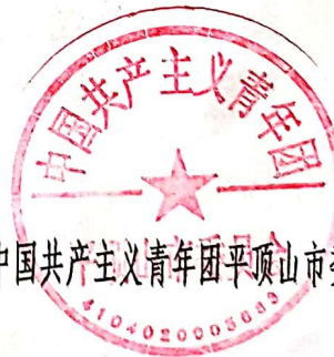
中国共产主义青年团平顶山市委员会