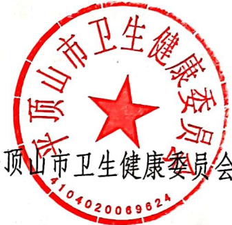
平顶山市卫生健康委员会