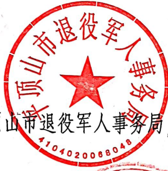
平顶山市退役军人事务局