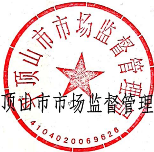
平顶山市市场监督管理局